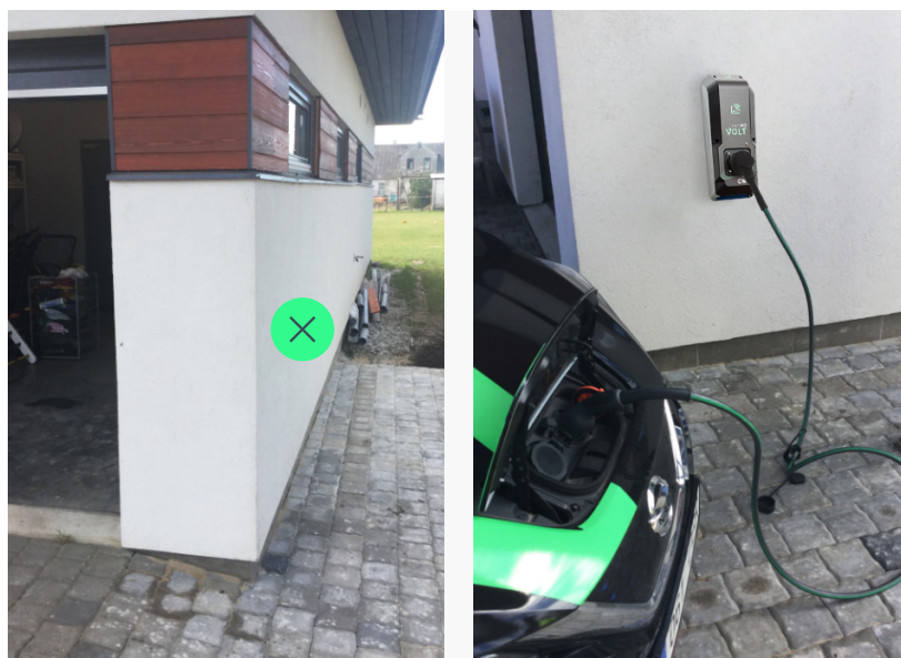
Foto on vajalik, et saaksime hinnata, kas maja seinale saab laadijat sobivalt kinnitada.

NB! Kui laadija paigaldus tellitakse eraldi laadimispostile või esineb vajadus täiendavate kaevetööde järele tähendab see automaatselt lisatööde hinnapakkumise koostamist paigaldusele!